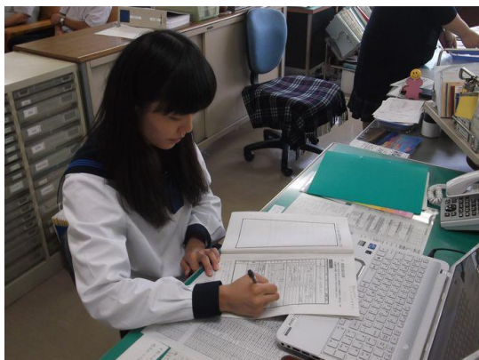
商工会での実習風景

富川高校では二年次において、企業体験学習（インターシップ）を導入しています。インターシップを通じて地域企業及び産業を理解し、社会人としての職業観・倫理観を育み、自己の特性と将来