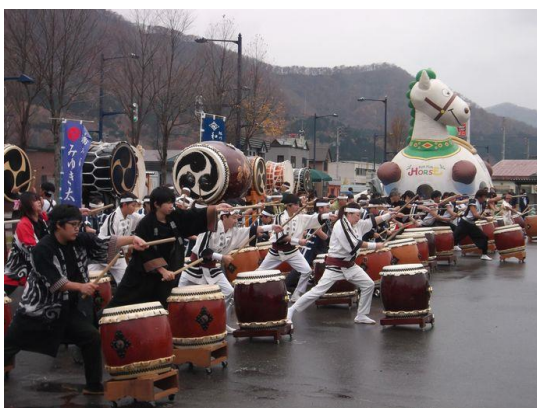
大太鼓「神」とフィナーレの演奏

日高町側では、最後に一〇団体約八〇人が合同演奏し、その際に大太鼓「神」も使用されました。